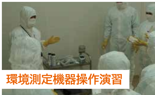
環境測定機器操作演習