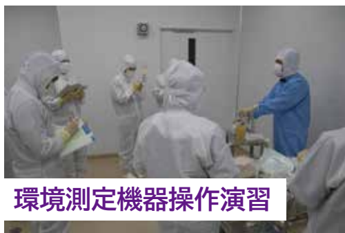
環境測定機器操作演習