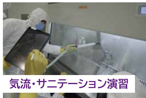
気流・サニテーション演習